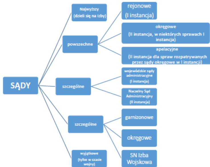
Rysunek 1. Struktura sądownictwa w Polsce